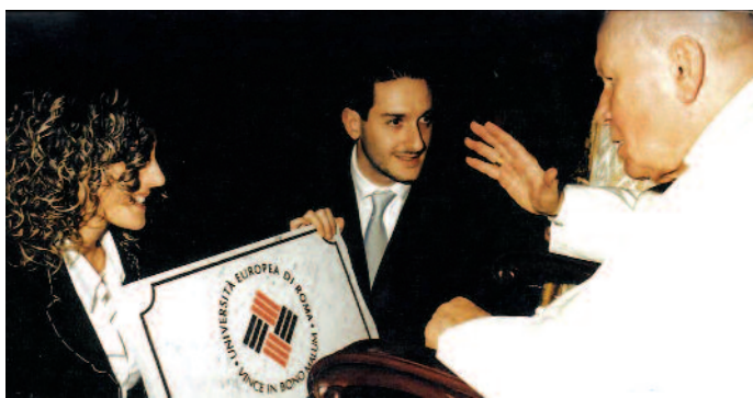
Un incontro con Papa Giovanni Paolo II

Pur avendo già da tempo chiaro l'obiettivo, solo in quel momento si materializzò l'impegno concreto che ci avrebbe atteso. E, da questo punto di vista, per me, la seconda tappa significativa fu proprio il trasferimento di ruolo dall'ateneo napoletano a Roma, che rappresentava non solo una scelta accademica,